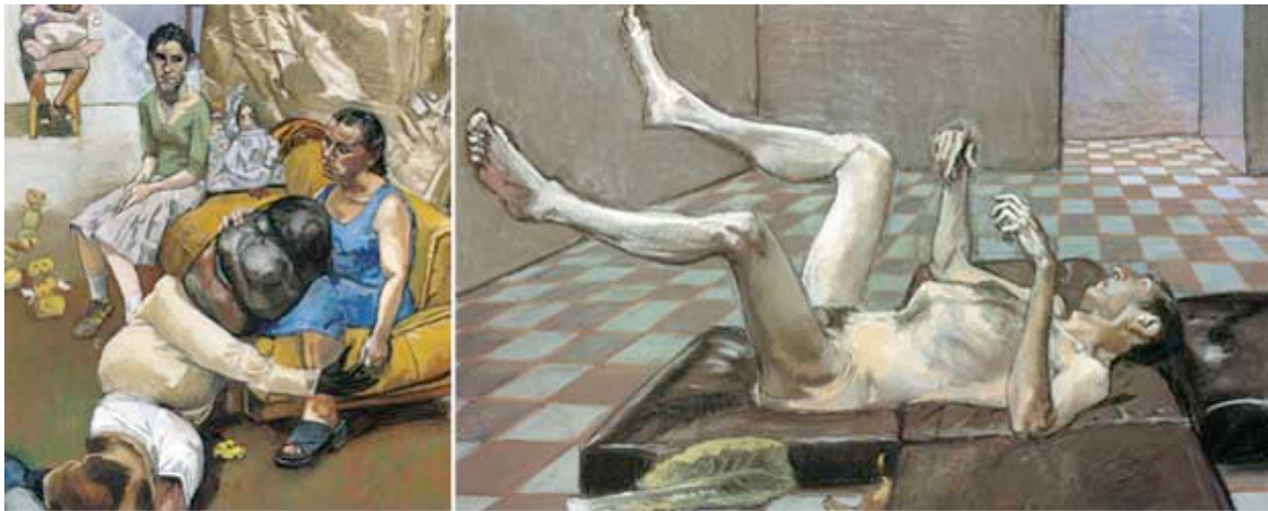
Obras de Paula Rego . A la izquierda, una parte del tríptico 'El hombre almohada' (2004); a la derecha, 'Metamorphoseándose según Kafka' (2002),